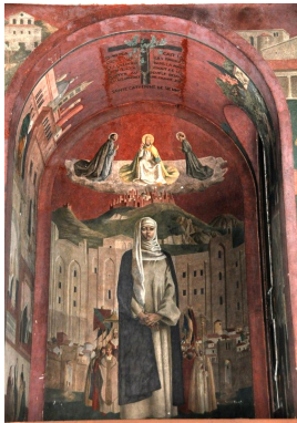
Fresque de Sainte Catherine de Sienne